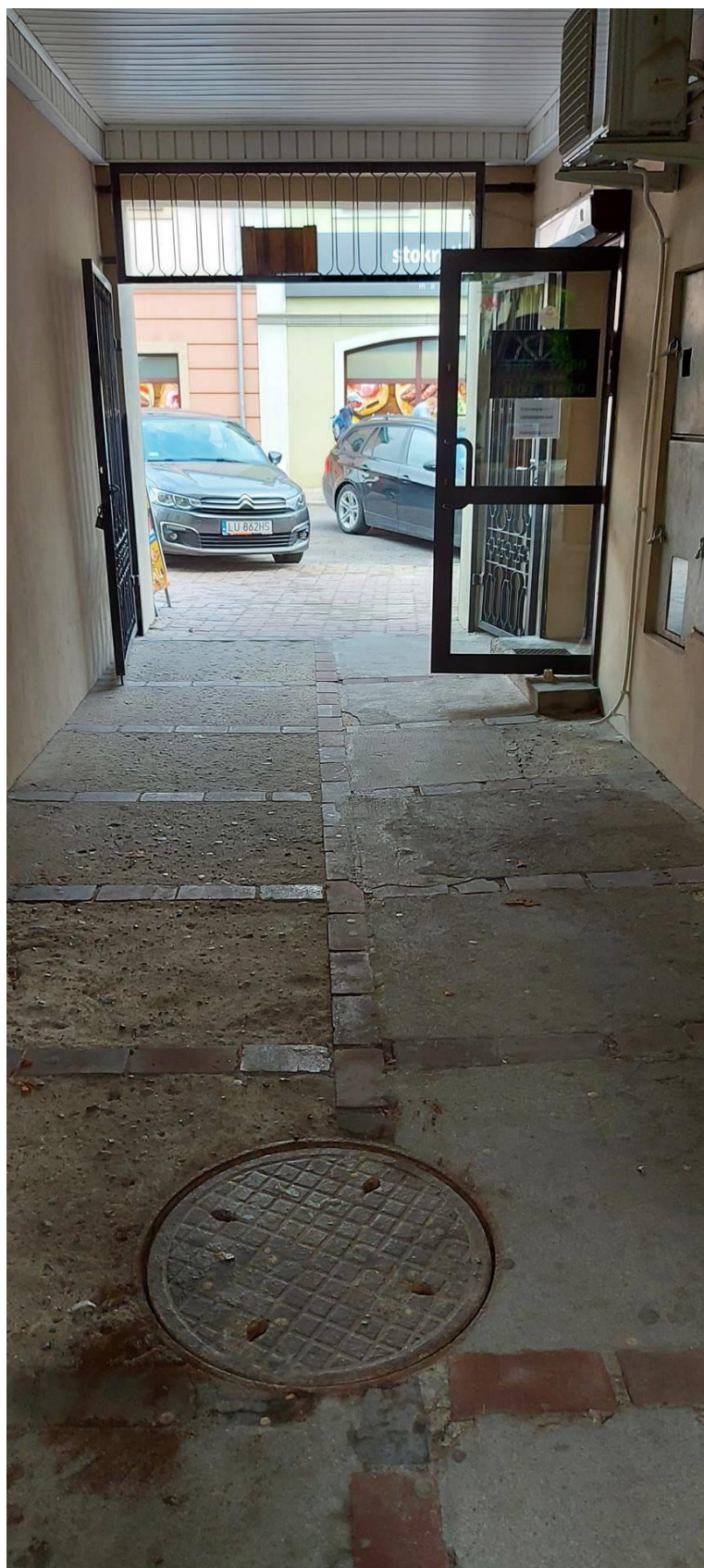
Foto 6. Miejsce awarii ul. Czysta w Krasnymstawie