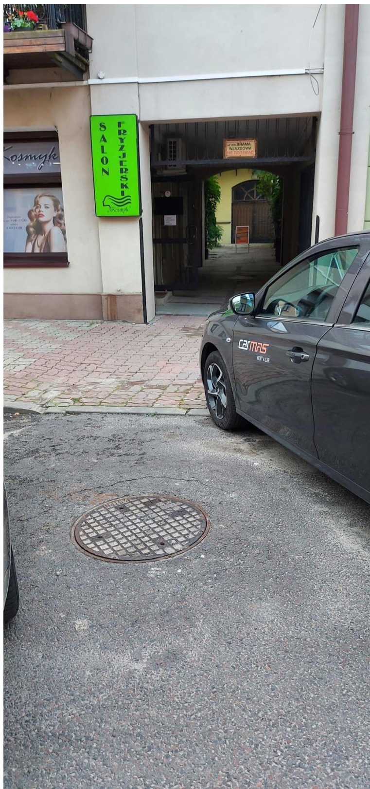
Foto 2. Miejsce awarii ul. Czysta w Krasnymstawie