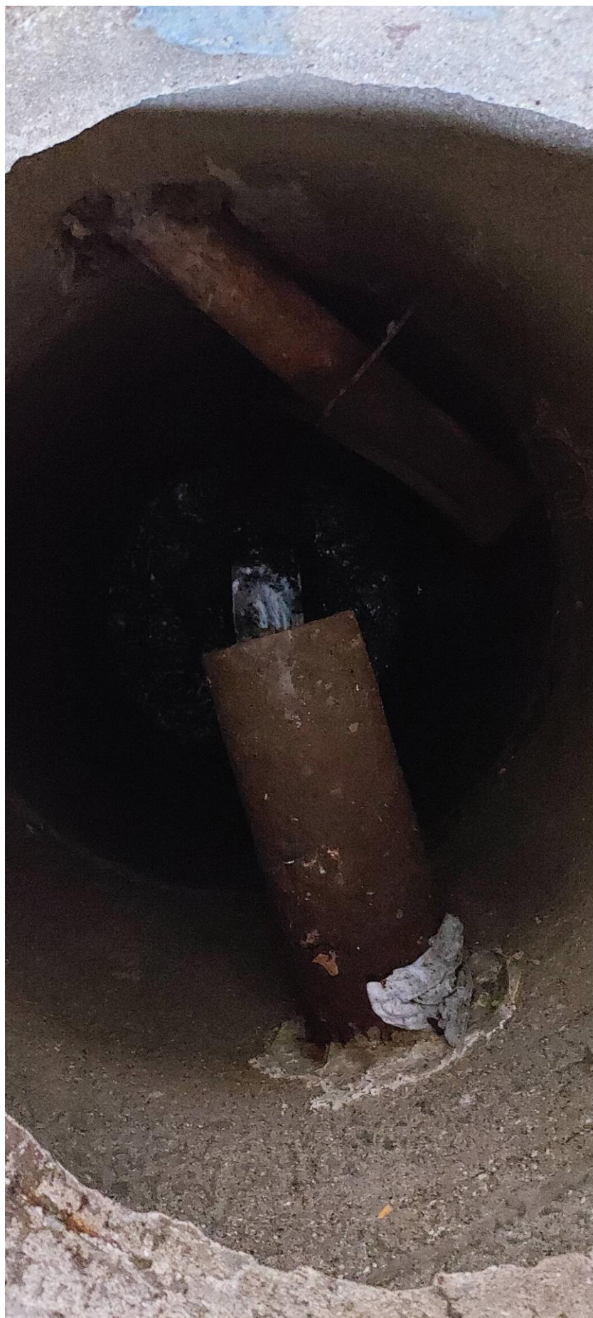
Foto 7. Miejsce awarii ul. Czysta w Krasnymstawie