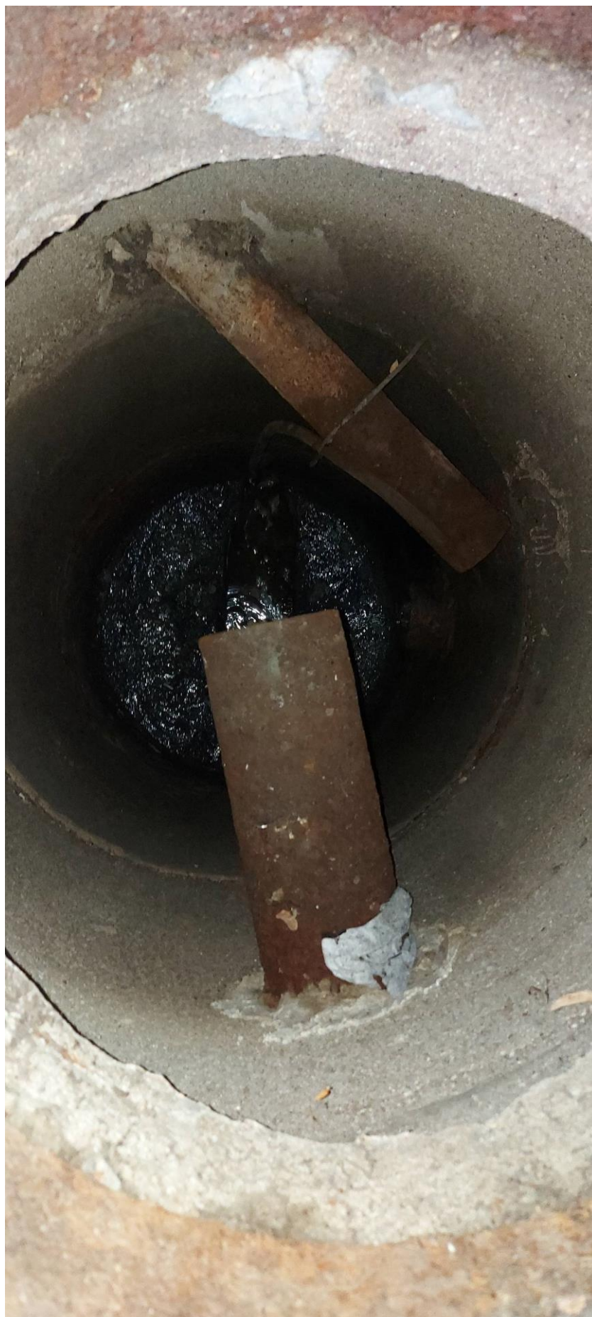
Foto 8. Miejsce awarii ul. Czysta w Krasnymstawie